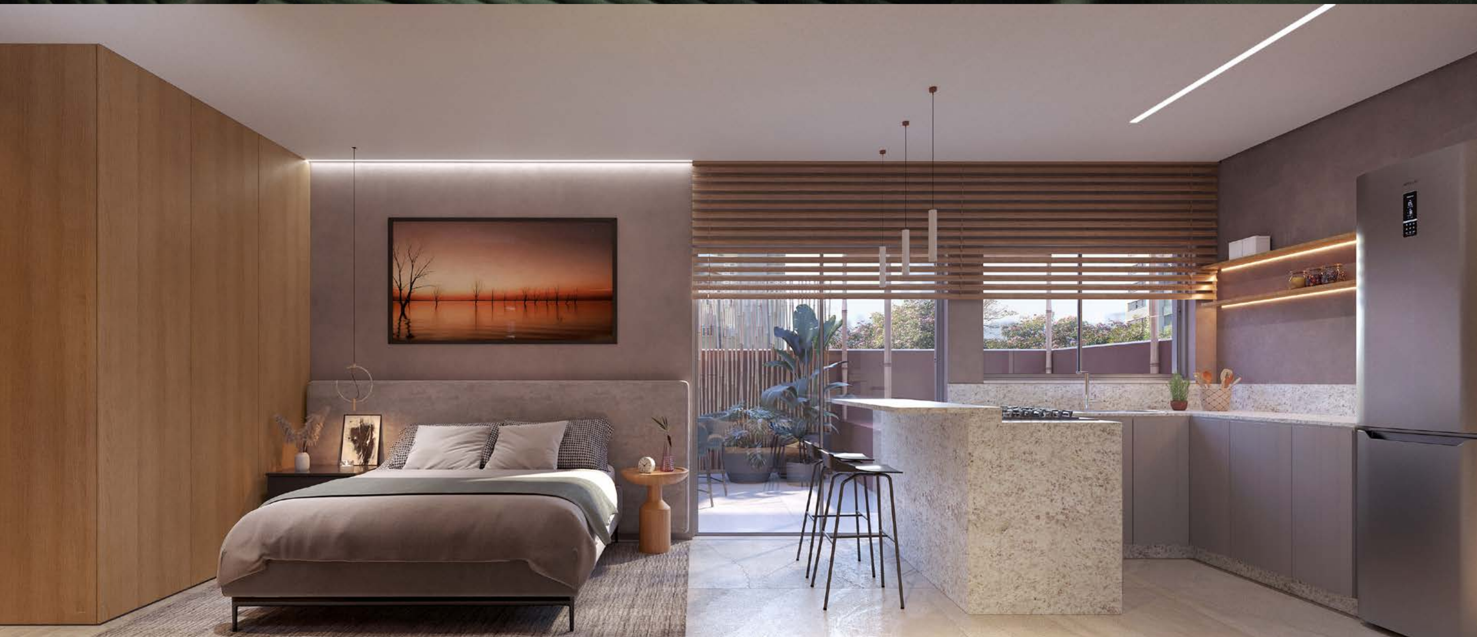
Perspectiva ilustrada do studio garden