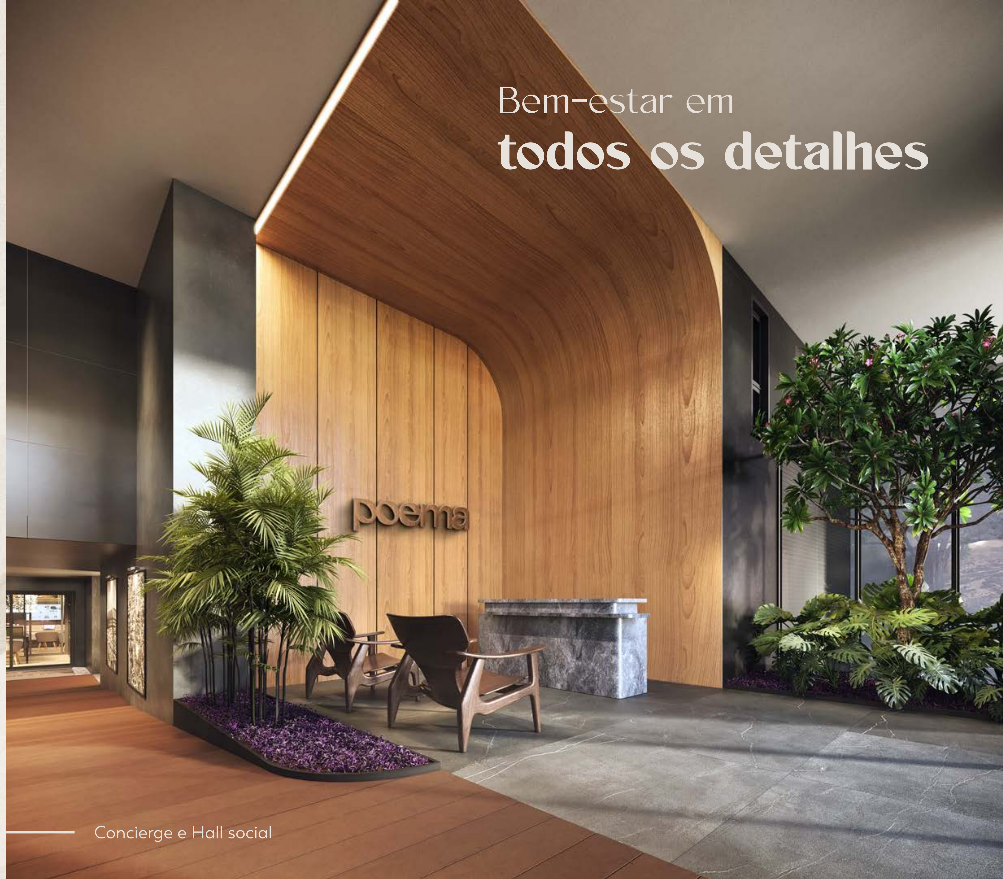
Concierge e Hall social