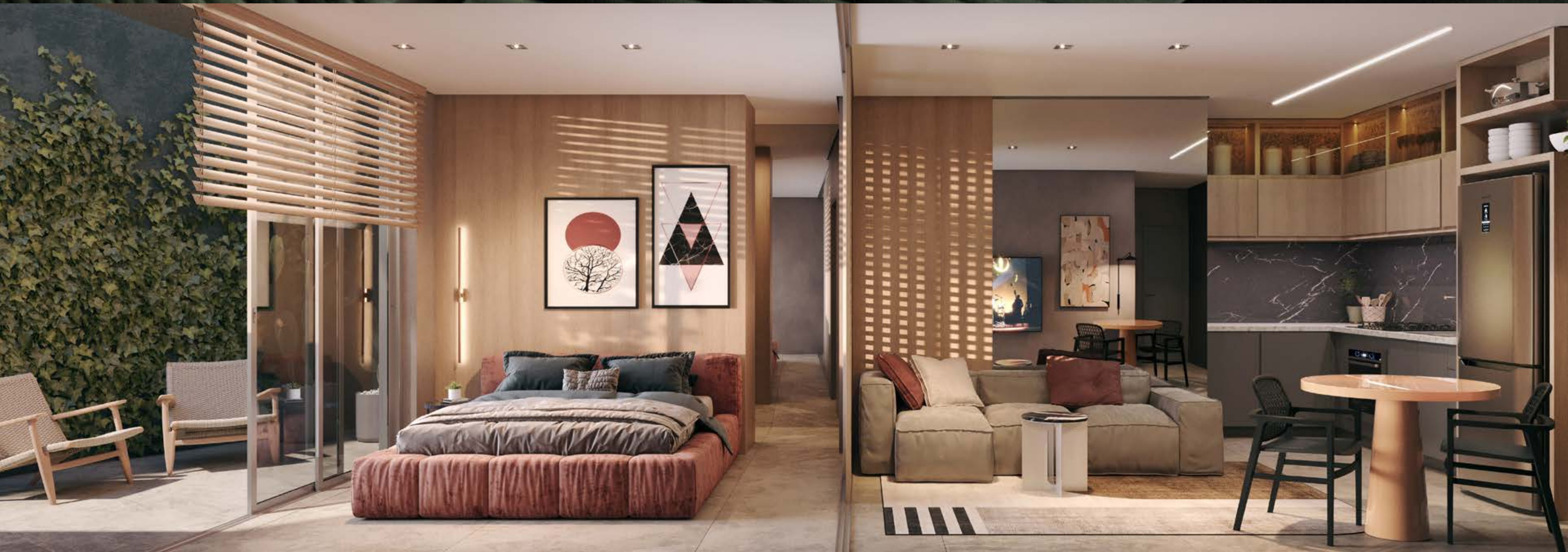
— Perspectiva ilustrada do studio 205