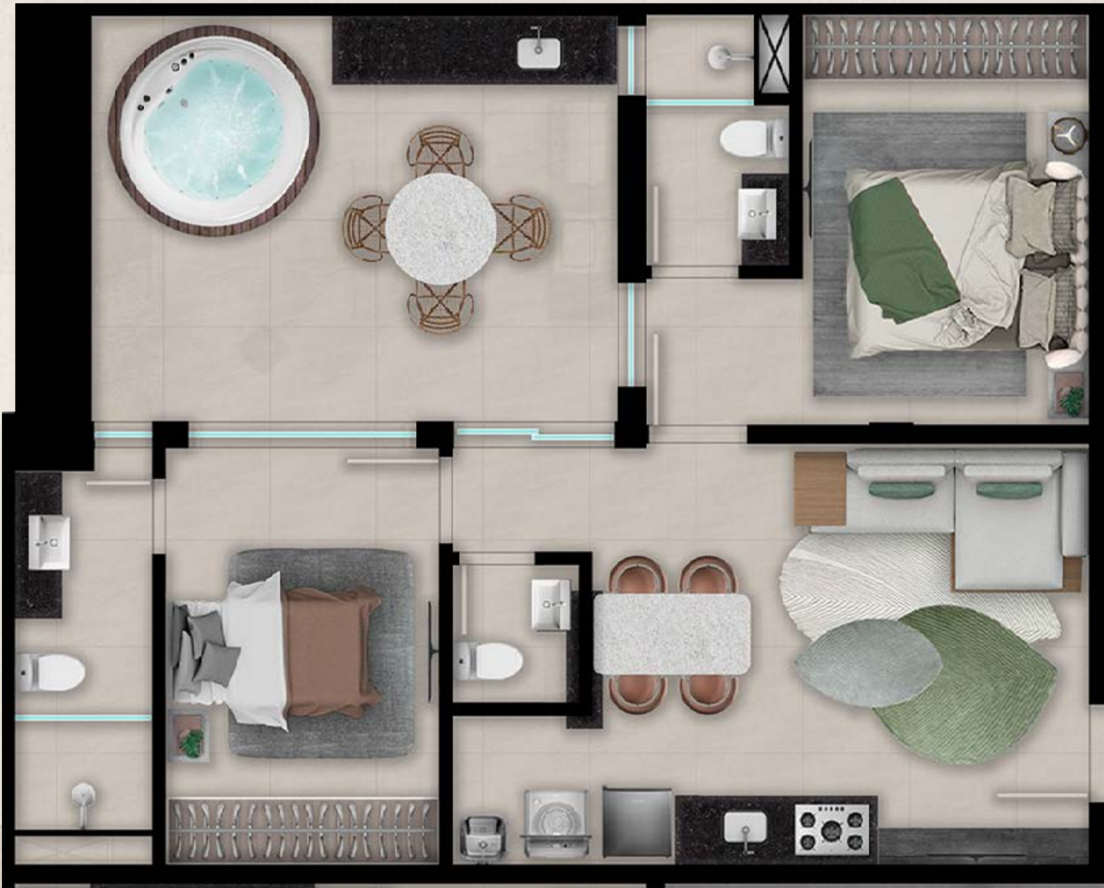
Mapa Chave . 2º Pavimento