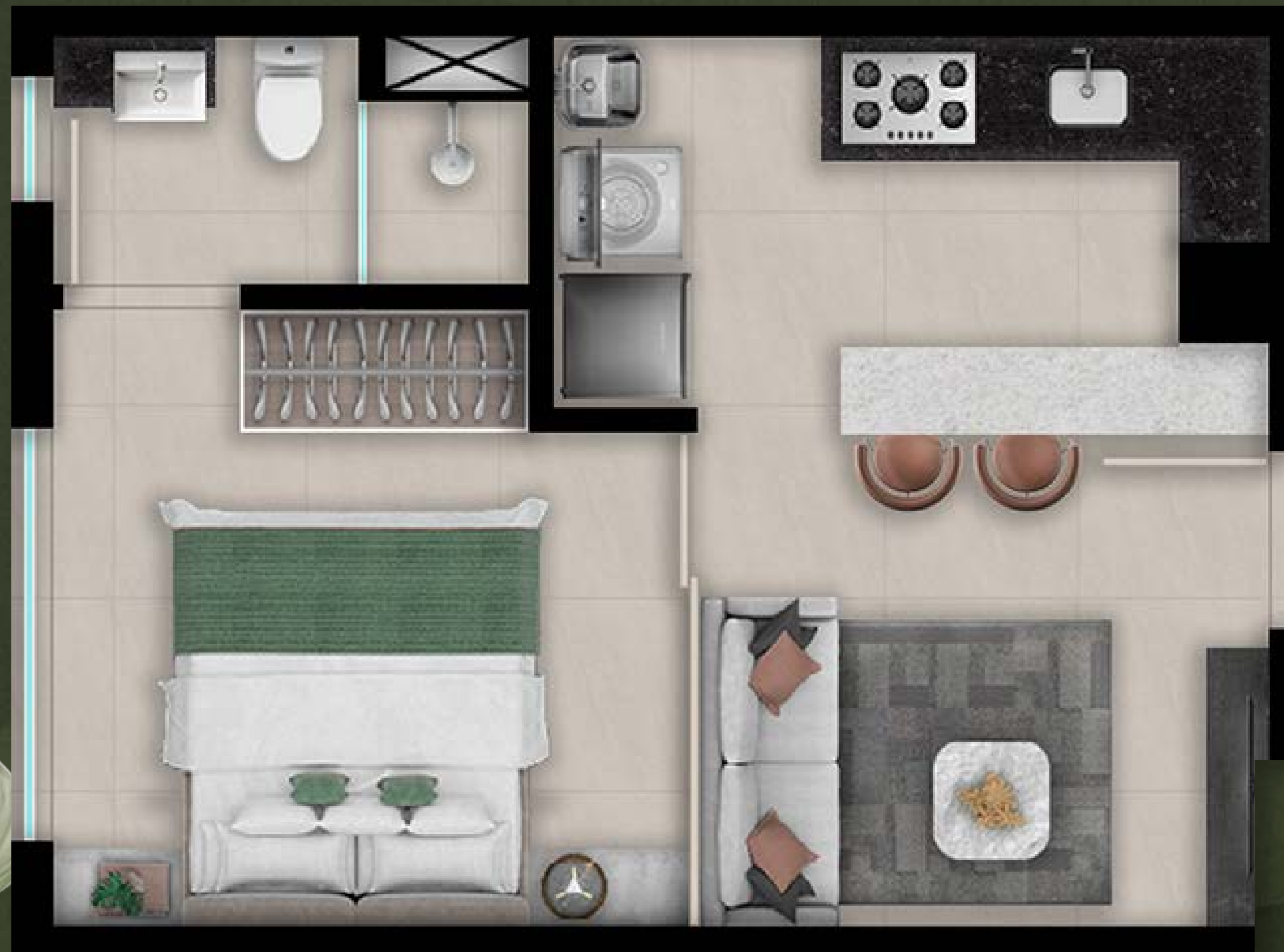
Mapa Chave . 3º Pavimento